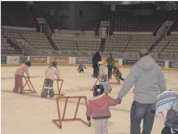
Fête de Noël le 13 décembre 2008.